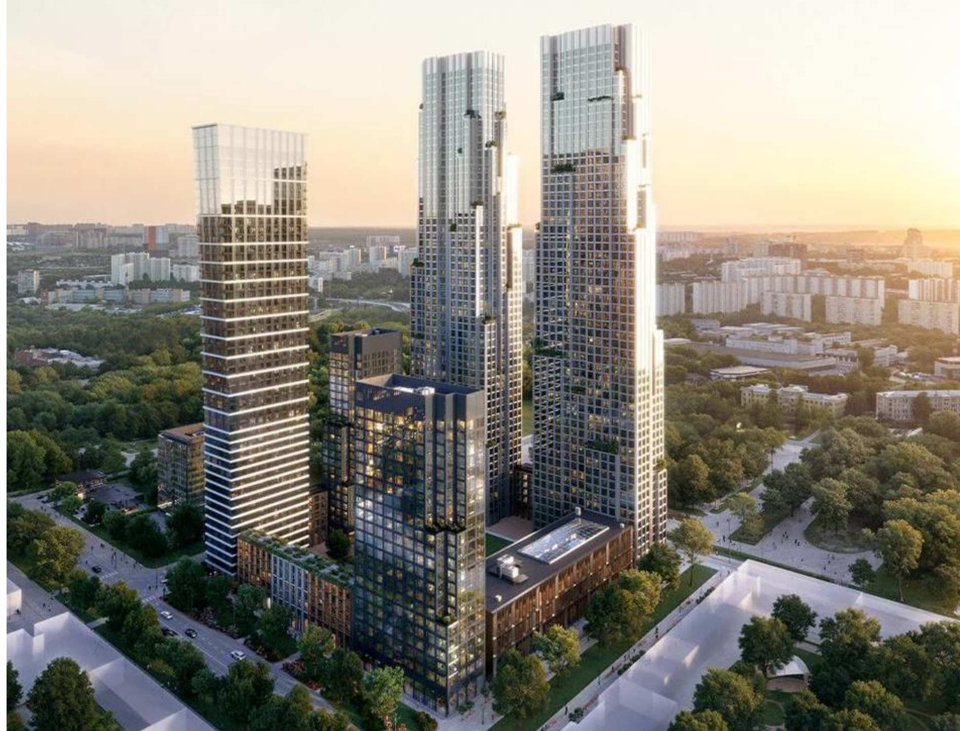
ЖК Veer, Москва. Девелопер MR Group, арх. бюро

Высокого прямоугольника из стекла со скучным фасадным рисунком уже недостаточно.