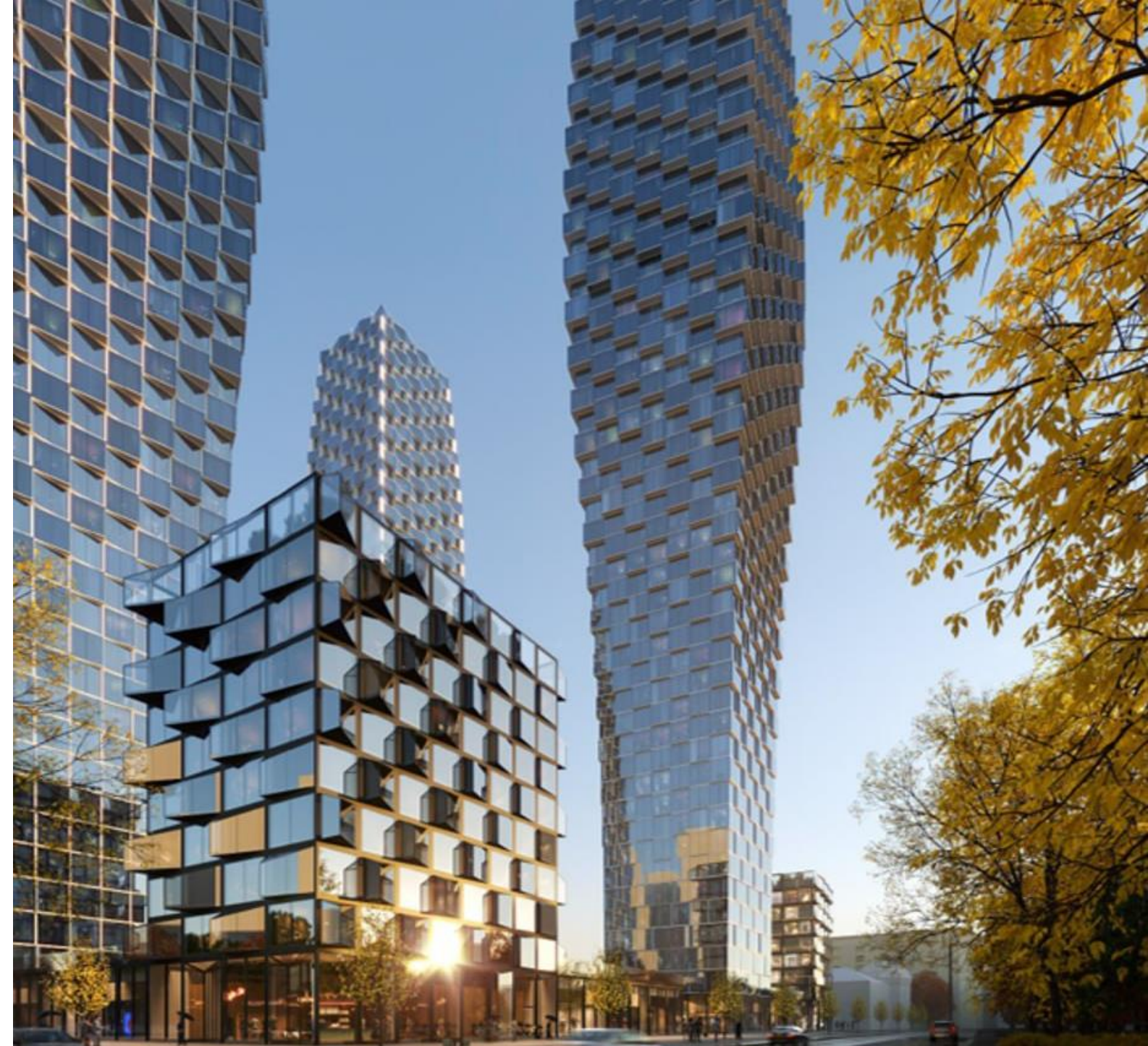
ЖК, Москва. Девелоппер MR Group