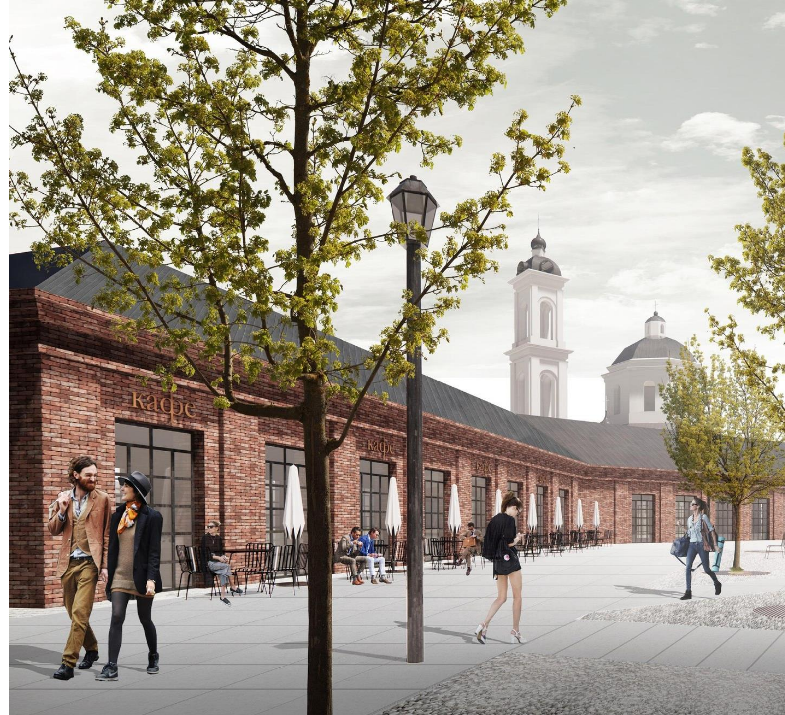
Мастер-план центра города Таруса. Арх. бюро Рождественка