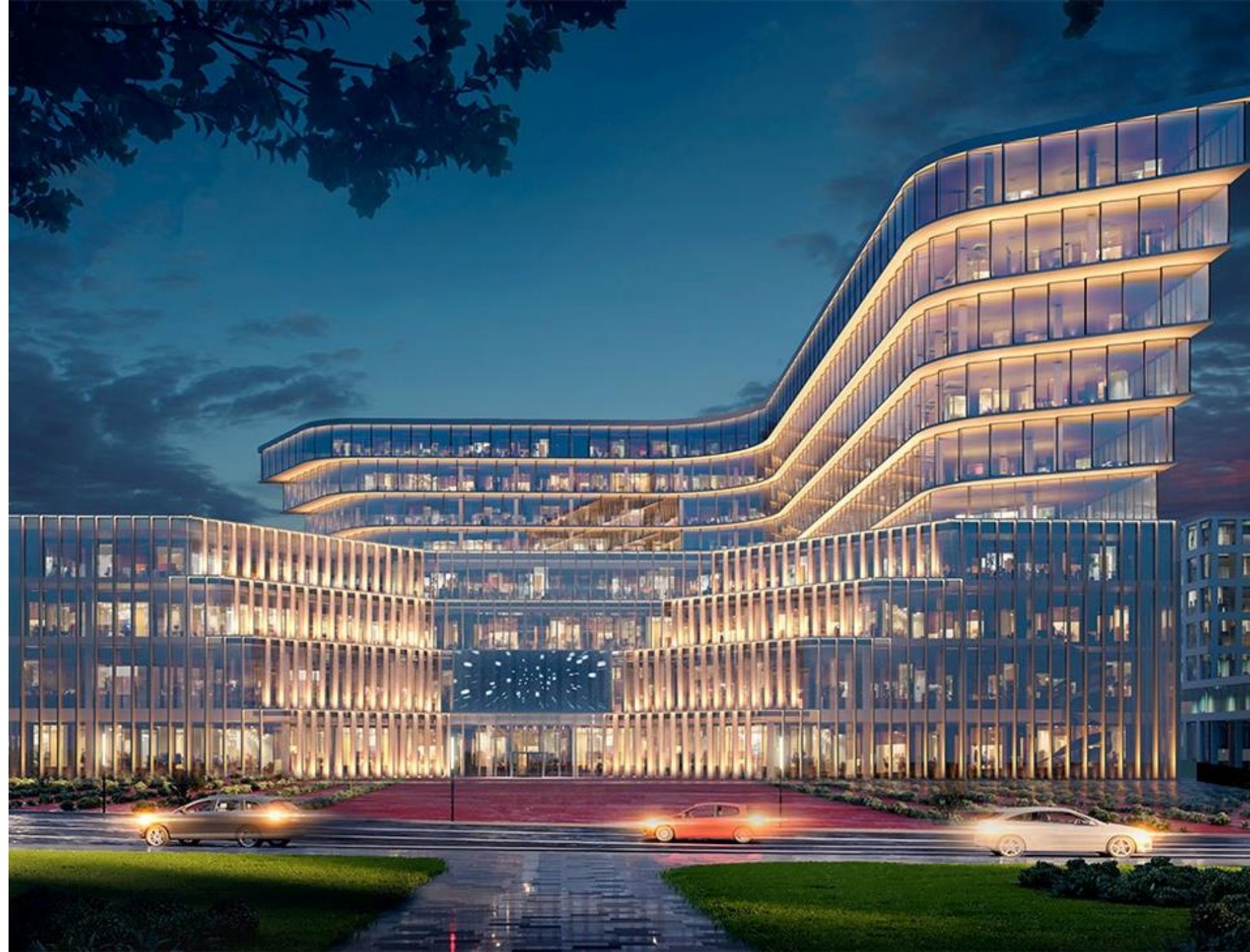
Учебно-образовательный кластер «Ломоносов», Москва. Арх. бюро KAMEN Architects