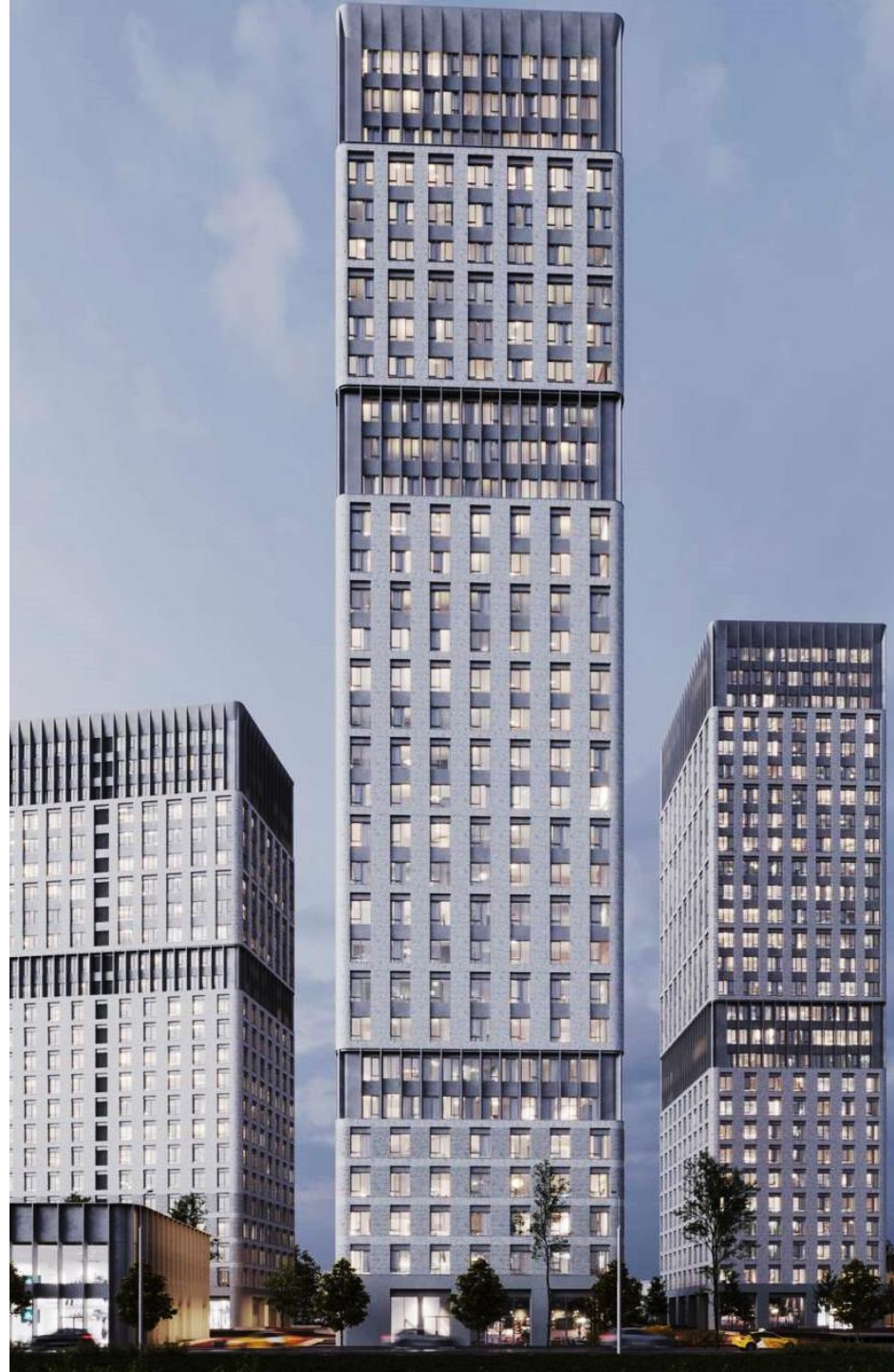
ЖК в Сокольниках. Арх бюро WALL