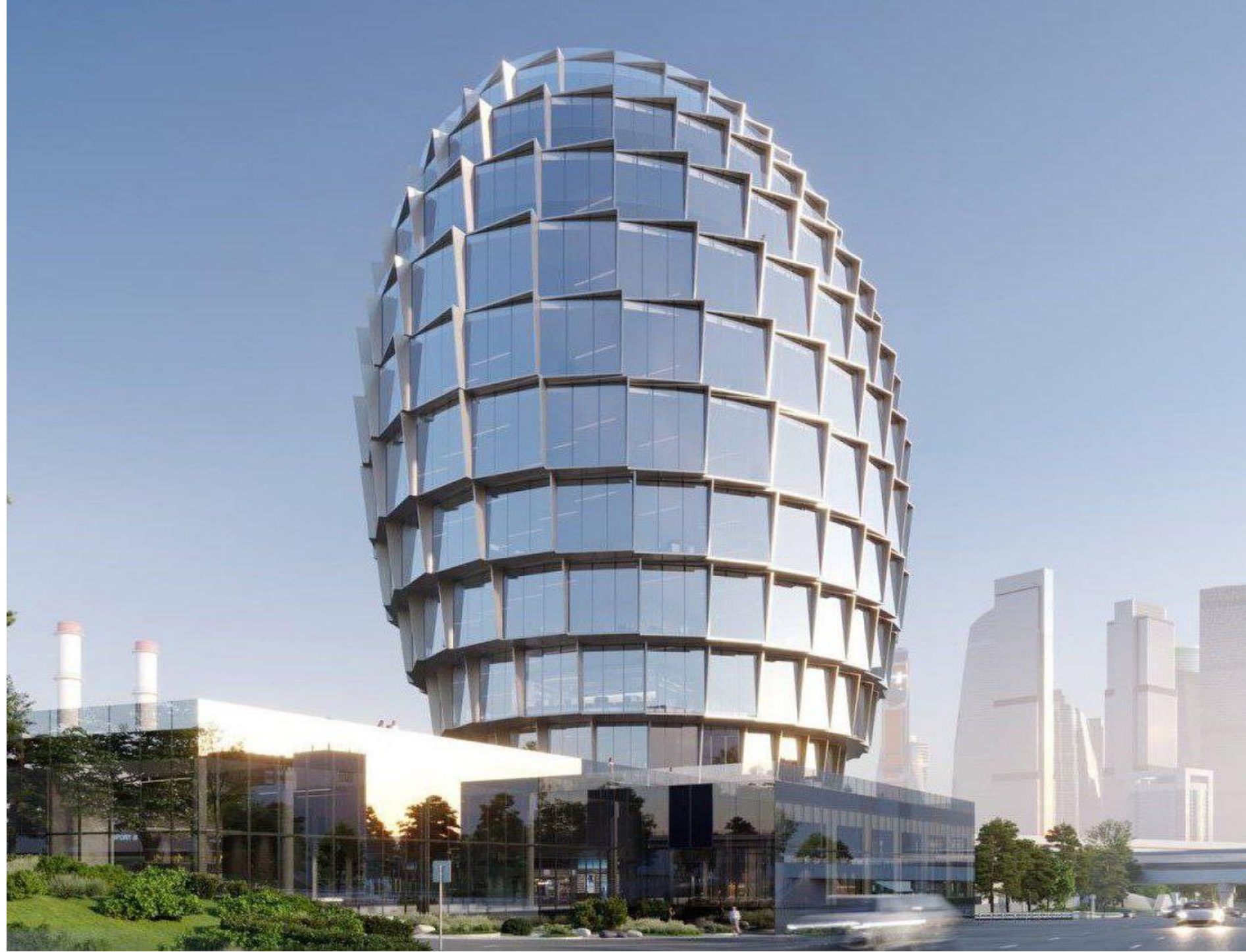
Офисный комплекс, Москва. Арх. бюро APEX