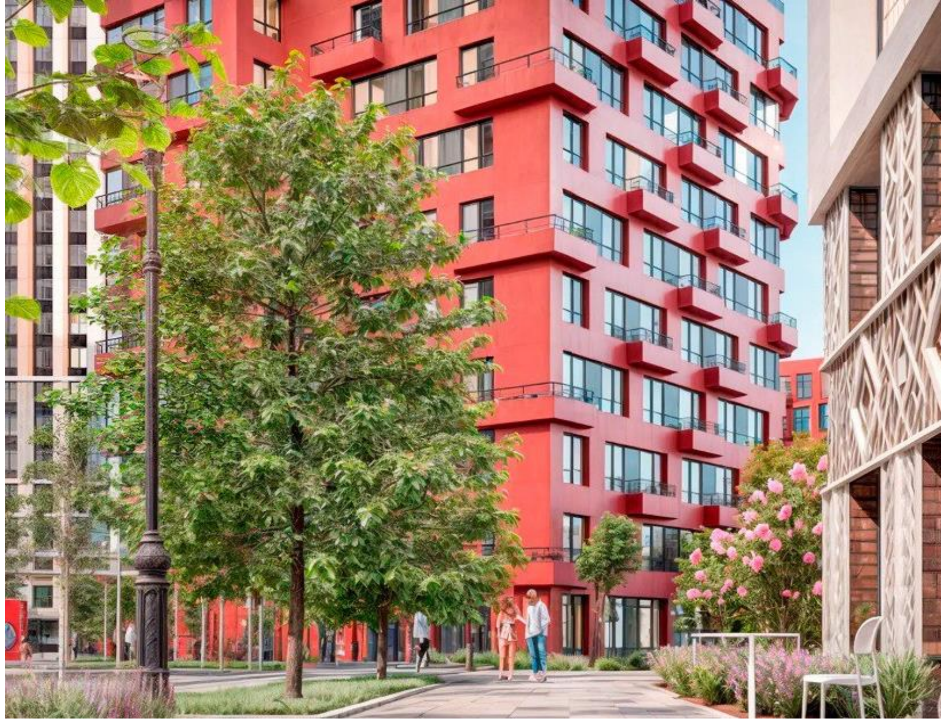
ЖК, Москва. Девелопер Крост

Если раньше оттенки зелёного, латунь, золото и медь часто использовались как акцент в элементах декора, то сейчас речь идёт об использовании этих цветов для всего объёма зданий.