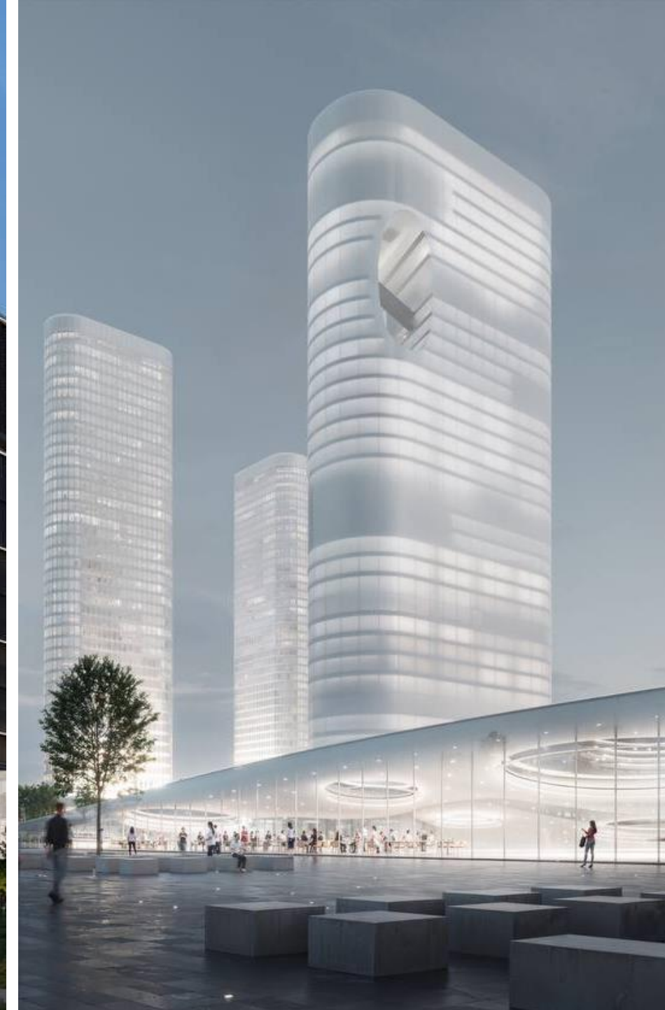
Казань. Арх. бюро WALL