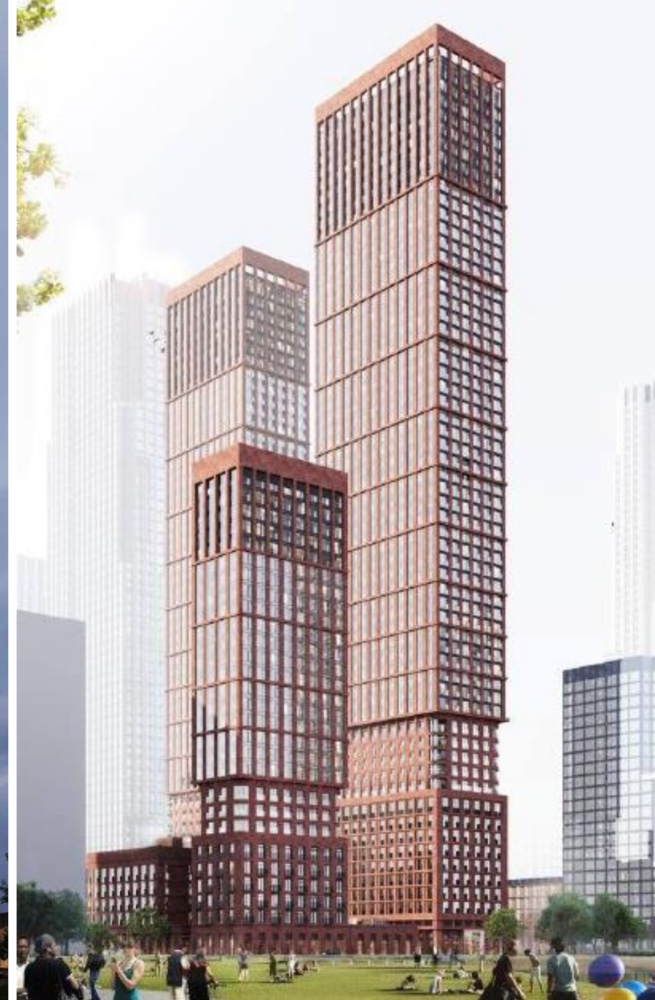
ЖК, Москва. Девелопер MR Group