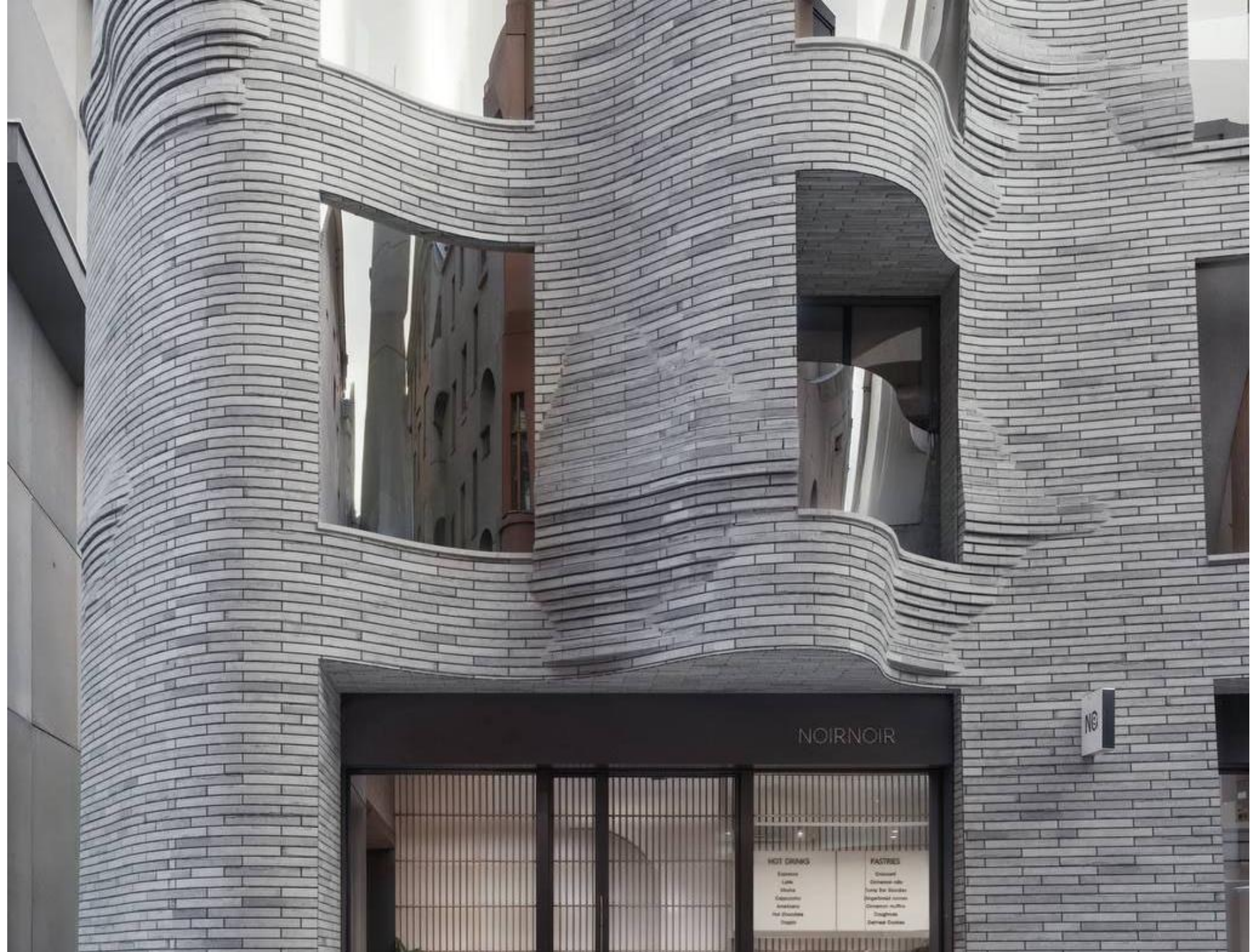
Veil, Москва. Арх. бюро WALL

В высотном строительстве это робкие колебания, а в объектах средней этажности линии более упругие.